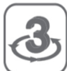
3 Jahre Garantie