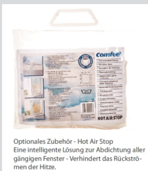
Optionales Zubehör - Hot Air Stop Eine intelligente Lösung zur Abdichtung aller gängigen Fenster - Verhindert das Rückströmen der Hitze.

Midea Europe GmbH Ludwig-Erhard-Straße 14 65760 Eschborn Deutschland +49 (0) 6196 90 20 0 info-meg@midea.com www.mideagermany.de