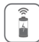
0,5W Stand by Verbrauch